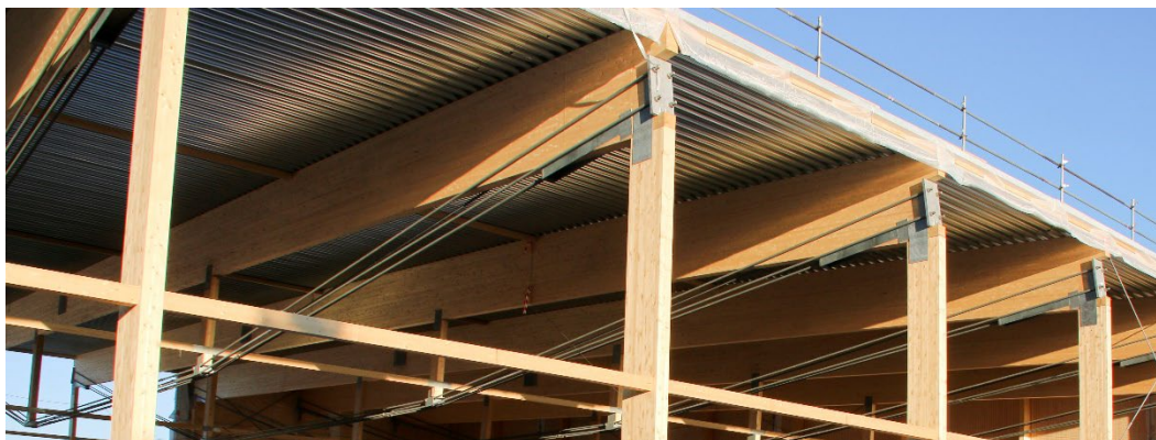
Figur 2. Takstolarnas typkonstruktion. Fotograf: Johan Enback. Bilden får spridas vidare med information om fotograf.