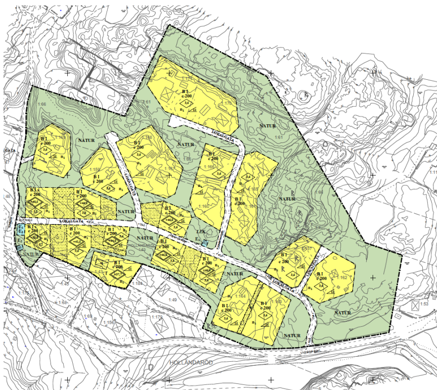
Förslag till ny detaljplan

Den gällande byggnadsplanen med den mark som idag är skyddad av förordnande enligt § 113 Byggnadslagen hamnar inom den nya detaljplanen för Del av Holländaröd 1:63 m.m. En mindre del av 113 § marken kommer i den nya planen att planläggas som kvartersmark, se bilder i planbeskrivningen under rubriken "Upphävande av förordnande". En stor del kommer dock enligt detaljplaneförslaget att fortsätta vara allmän plats och få planbestämmelsen Lokalgata och Natur. I planförslaget avsätts en yta för en lekplats samt ytor för att bibehålla möjligheten att vandra genom området. En idag populär utsiktsplats kommer även att finnas kvar.