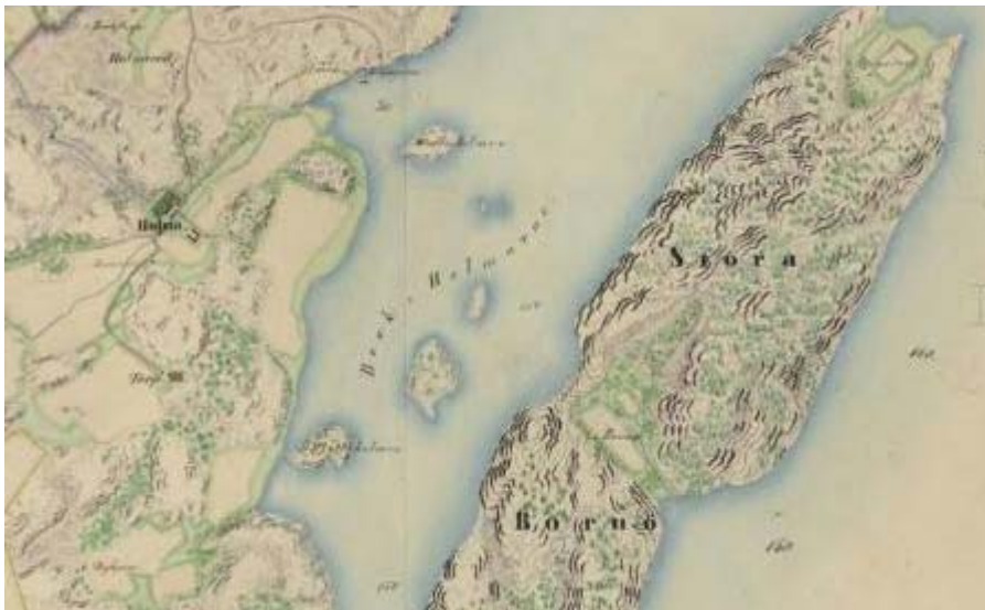
Detalj av sockenkarta från 1848 över Brastad socken (lantmäteriakt N11-1-2). Utsnittet visar området kring säteriet Holma med Stora Bornö.

Så kallade sockenkartor har främst upprättats under två perioder, dels från slutet av 1600-talet fram till början av 1700-talet, dels mellan 1845 och 1859. Behovet av större översiktskartor började växa fram i början av 1800-talet då man insåg vikten av att ha enhetlig nationell statistik. Lantmäteristyrelsen arbetade under första hälften av 1800-talet med att ta fram ett enhetligt sockenmaterial i en egen underavdelning, det så kallade Sockenkarteverket . Arbetet började planeras redan 1827, men kom alltså inte att påbörjas förrän 1845, men det finns exempel på kartor som upprättats redan före 1845.