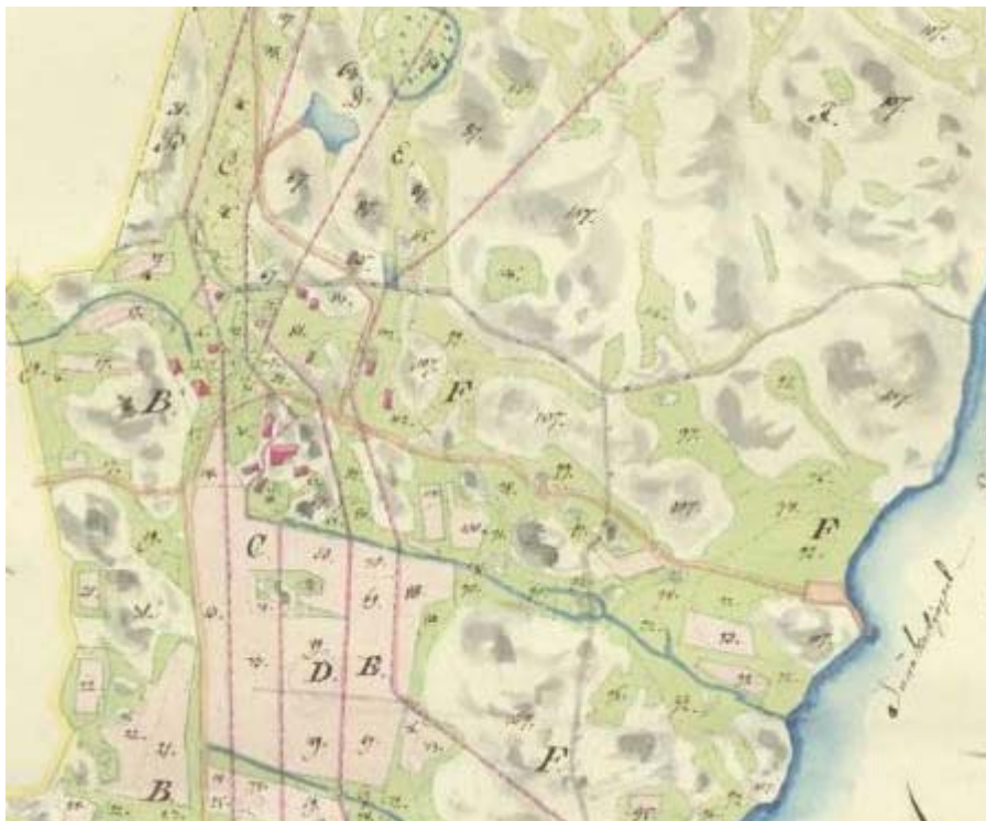
Detalj av enskifteskarta över Stuveröd, Skaftö sn, från 1823 (lantmäteriakt N96-18-4).

Enskiftet under början av 1800-talet innebar nästa skiftesreform, nu sammanfogades ännu fler mindre ägor till större enheter. Från Bro socken finns tolv kartor från perioden 1822-1826. Från Brastad socken finns sju enskifteskartor från tiden 1820-1827. Över Lyse socken finns fyra kartor från perioden 1822-1826, medan det från Skaftö socken finns två enskifteskartor, båda från 1823.