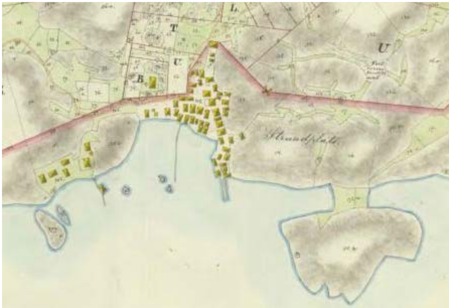
Detalj av laga skifteskarta från 1861 av Gåsö, Skaftö sn (lantmäteriakt N96-9-1). På kartan är öns fiskeläger och bebyggelse noggrant avbildad.