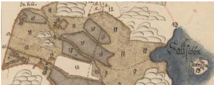
Detalj av geometrisk karta över Ingeröd, Bro sn, från 1694 (lantmäteriakt N1:54).