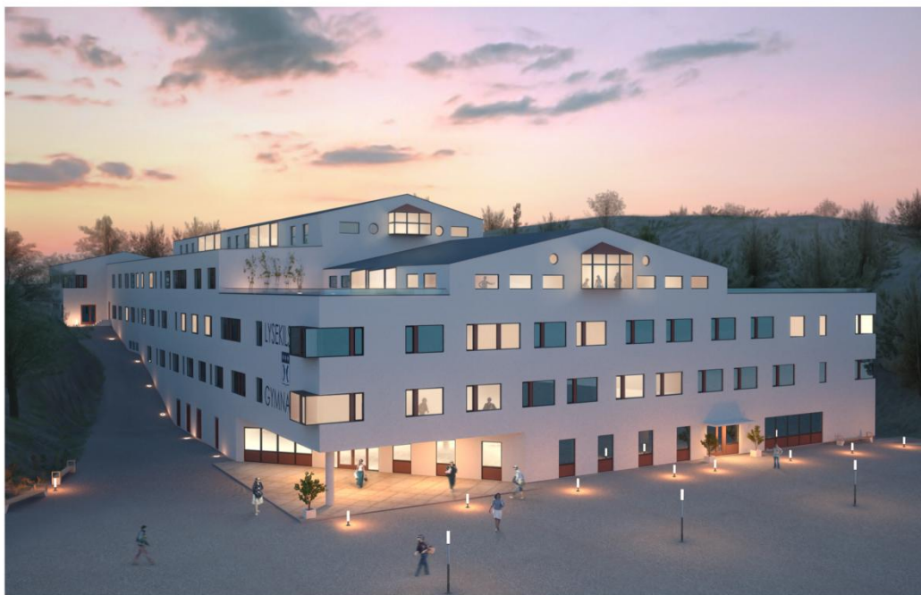
PERSPEKTIV A010 RÅDMÅTEN ARKITEKTER

En gemensam organisation behövs för att skapa så effektiva och kvalitativa lösningar som möjligt och förhindra att människor faller mellan stolarna. En enhet med ett samlat ansvar för kommunmedborgarnas behov av kommunala arbetsmarknadsinsatser och utbildning enligt principen "en dörr in" kommer att utvecklas under 2010.